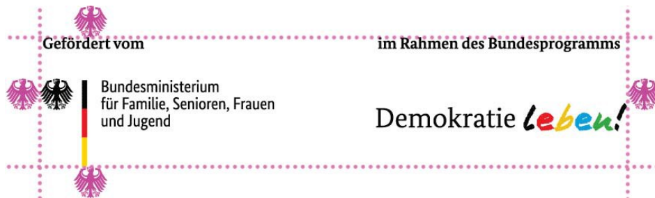
Illustration: Schutzraum um das Logo